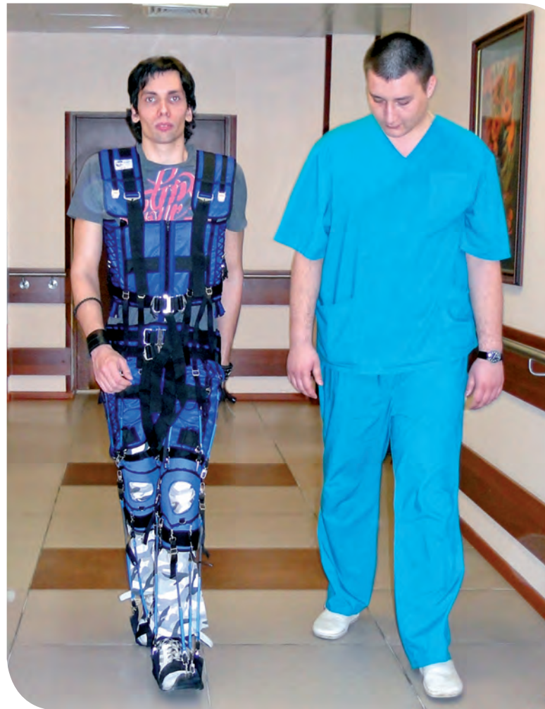
Костюм для восстановления двигательной функции из богатого арсенала реабилитационных средств НПЦ

Осмотр Центра начался с замечательной библиотеки, в которой клиенты могут пользоваться не только книгами, но и современной аудио- и видеопродукцией, участвовать в творческих мастер-классах. В учреждении оказалось много любопытного. Прежде всего,