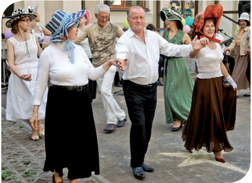
Ретро-фестиваль «Москва – моя первая любовь» в ТЦСО «Арбат»

На базе ТЦСО «Мещанский» открыт Клуб молодых предпринимателей-инвалидов. Департамент малого бизнеса выделяет средства на открытие своего дела, но нужен толковый, реальный бизнес-проект. Сейчас молодые инвалиды пишут бизнес-проекты,