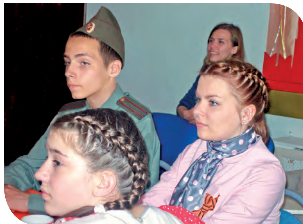
Под впечатлениям живых голосов истории

В трех километрах от нас был военный аэродром Быково. Немецкие самолеты летали бомбить его.