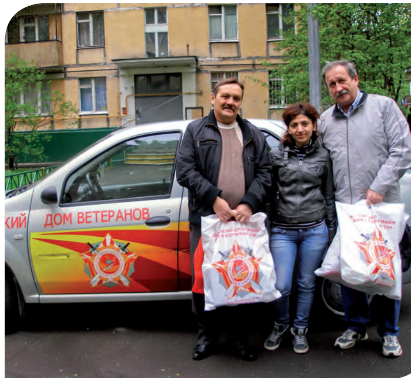
Бригада службы «Санаторий на дому»