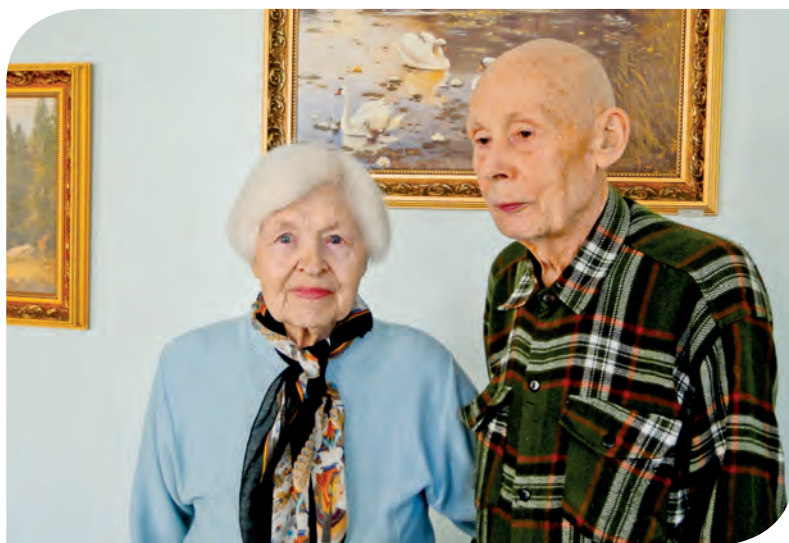
На восстановительном лечении в Социально-реабилитационном центре Московского Дома ветеранов войн и Вооруженных Сил

В городе действуют более тысячи всевозможных кружков, где представители старшего поколения могут самореализоваться: заниматься живописью, декоративно-прикладным искусством, овладевать