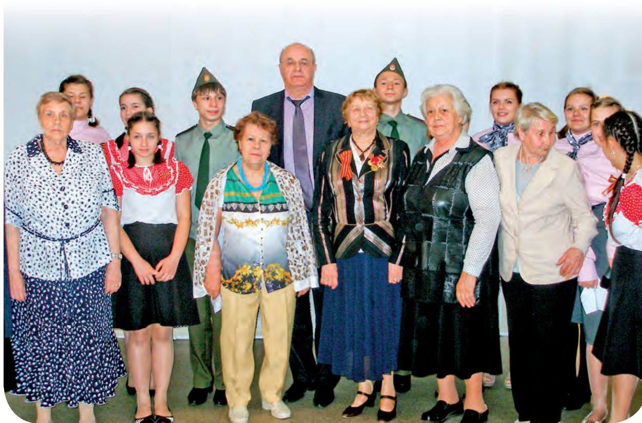
Фото на память о встрече