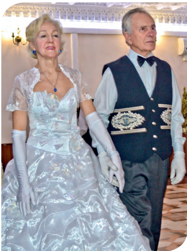
Одно из главных увлечений старшего поколения – исторические бальные танцы

актерским мастерством. Работают клубы по изучению иностранных языков.