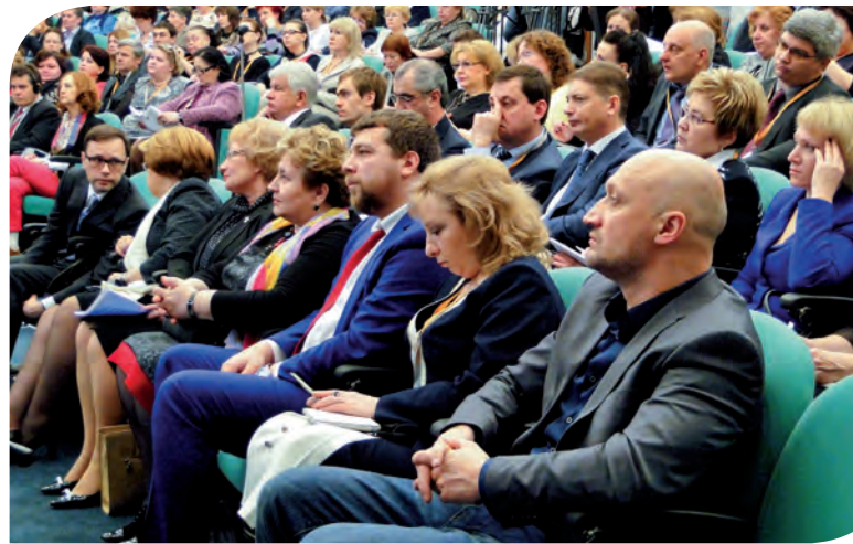
Среди участников конференции – учредитель Благотворительного фонда «Шаг вместе» – заслуженный артист России Гоша Куценко (справа)