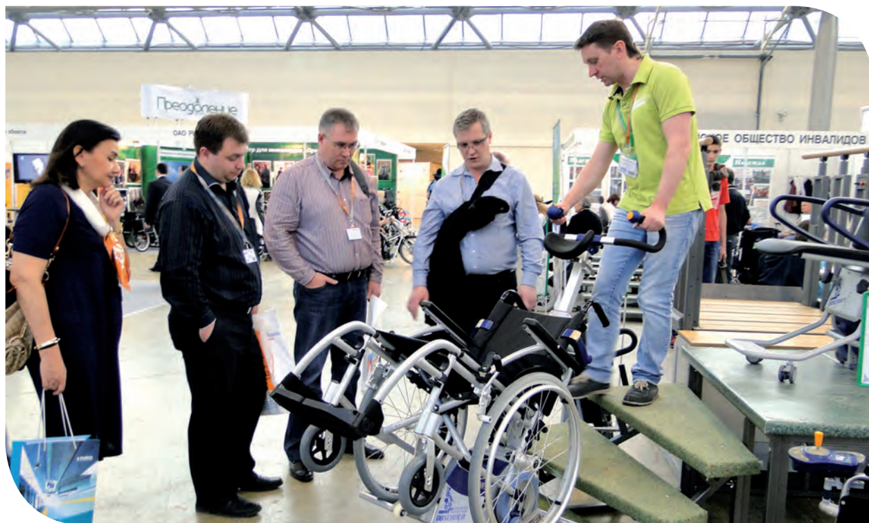
Для новой модели кресла-коляски ступеньки – не преграда