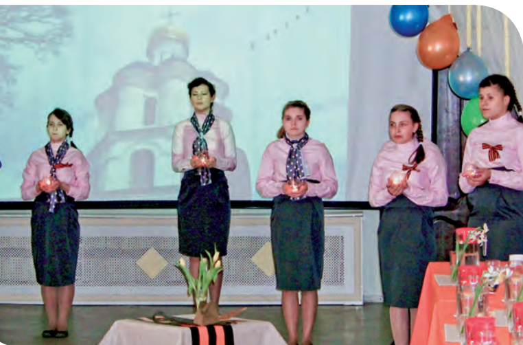
«Летит, летит по небу клин усталый»

она ни дня не сидела сложа руки: 15 лет возглавляла одну из ветеранских организаций района, увлекалась живописью и вязанием. Свои художественные работы и рукоделье она раздаривает друзьям, которых у нее немало: натура такая!