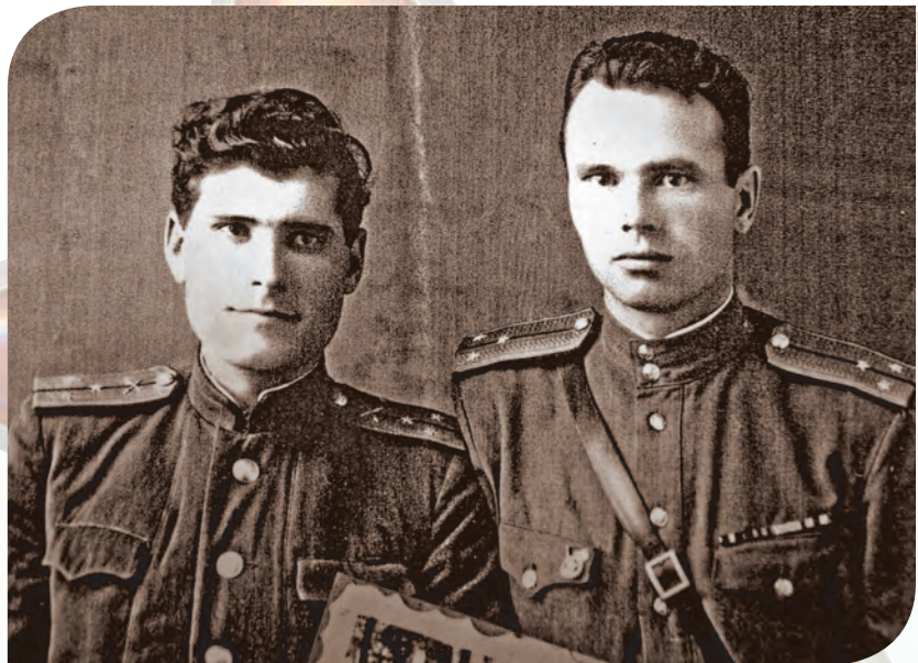
«Сороковые, роковые, свинцовые, пороховые...»