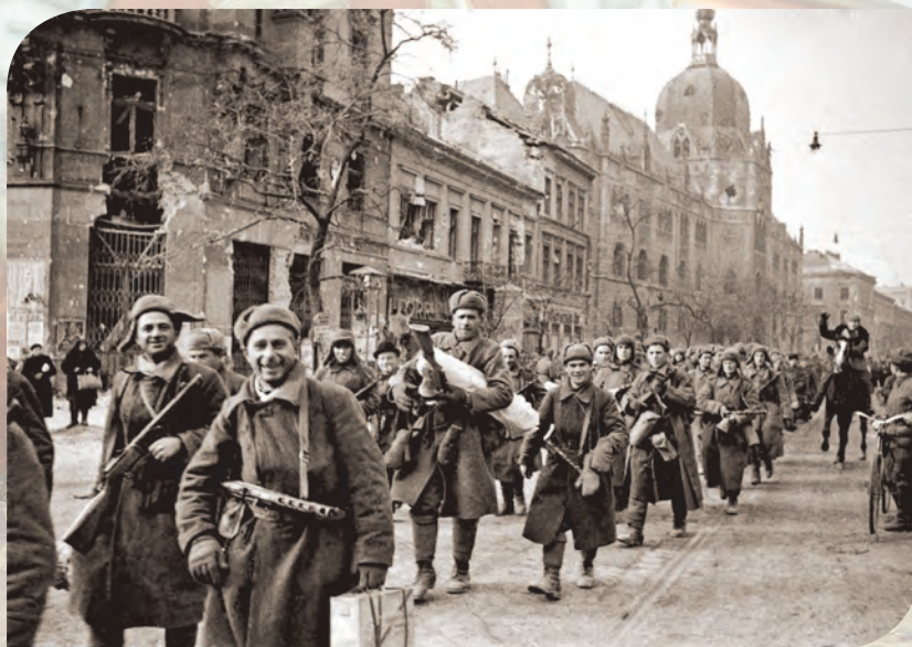
Колонна советских солдат на улице Будапешта

– Господи, дай дожить до утра!.. До вечера!.. До завтра! До рассвета! Не я один просил об этом. Сколько б ни воевал, всё равно страшно. Но если поднялся в атаку – не остановить. У Клетской мы