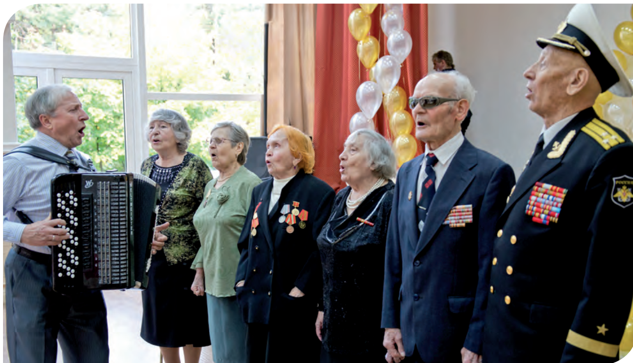
Старые песни о главном