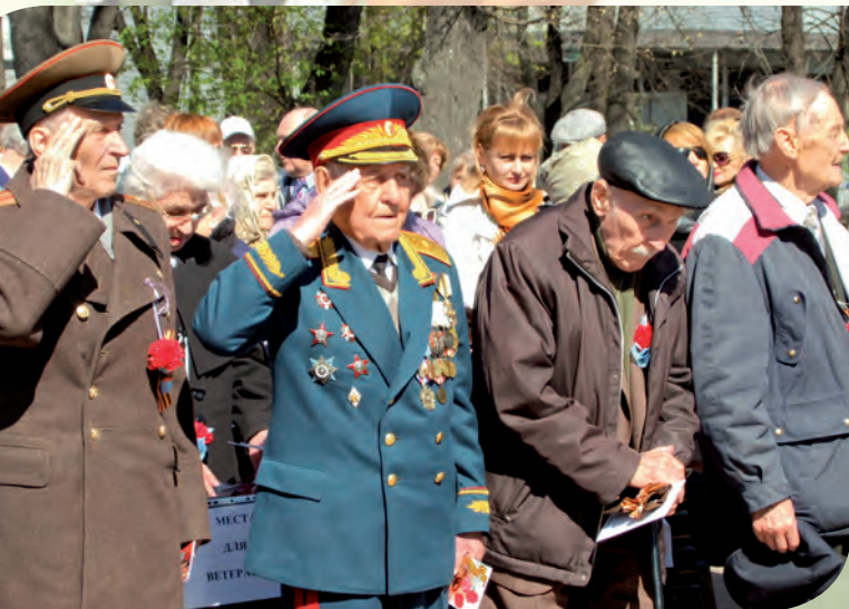
Ветераны отдают честь при выносе Государственного флага РФ

– Замечательно, что здесь собрались и дети, и родители, и ветераны. Это олицетворяет наше единодушие по отношению к подвигу народа во имя Великой Победы. Знания и опыт ветеранов, их воспоминания о событиях военного лихолетья крайне необходимы