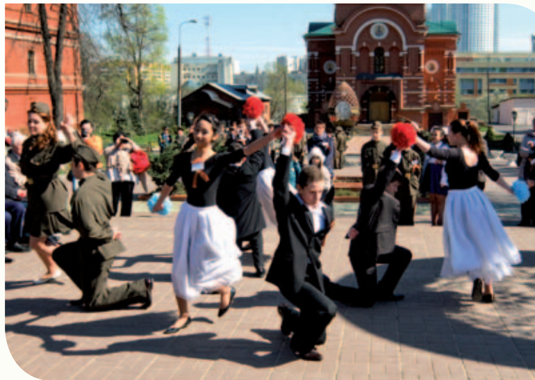
Танцевальный номер «Россия»